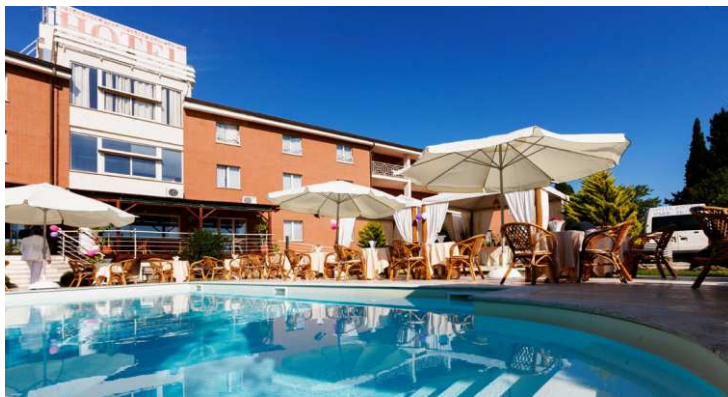
Ostia Antica Park Hotel